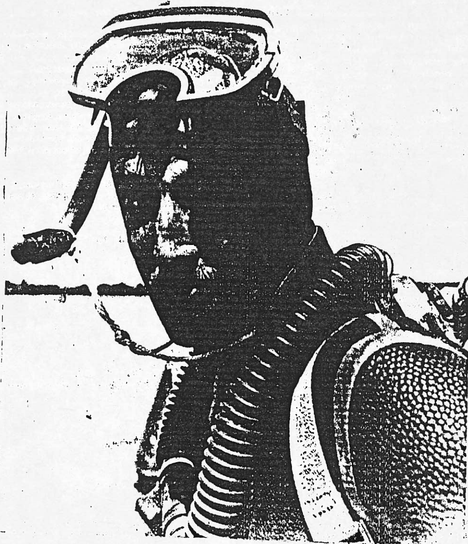
Na zdjęciu: Krab z przymrużeniem oka.